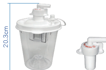
800毫升丟棄式收集瓶